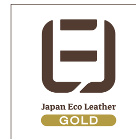
表面（ゴールドの場合）